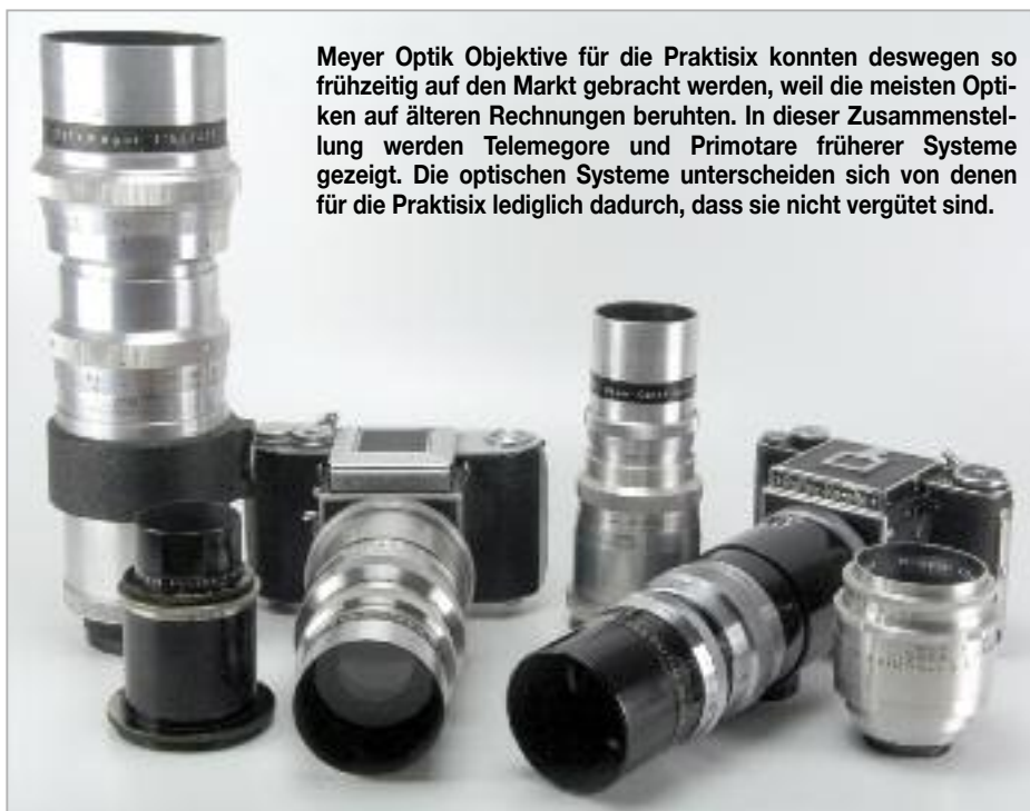
Meyer Optik Objektive für die Praktisix konnten deswegen so frühzeitig auf den Markt gebracht werden, weil die meisten Optiken auf älteren Rechnungen beruhten. In dieser Zusammenstellung werden Telemegore und Primotare früherer Systeme gezeigt. Die optischen Systeme unterscheiden sich von denen für die Praktisix lediglich dadurch, dass sie nicht vergütet sind.

Die Praktisix wurde zur Leipziger Herbstmesse 1956 vorgestellt, kurz darauf auch bei der Photokina in Köln. Carl Zeiss Jena und Meyer Optik Görlitz waren in der Pflicht, die Objektive zur Kamera zu liefern. Beide Hersteller scheinen mit einem unterschiedlichem Konzept an die Aufgabe herangetreten zu sein. Zeiss stellte 1956 zur Praktisix lediglich das Tessar 2,8/80 und das Flektogon 2,8/65 vor. Die beiden Objektive waren nicht unbedingt neu. Das Flektogon wurde schon 1950 für die Meister Korelle gerechnet. Auch das Tessar beruhte auf einer ebenfalls jungen wenn auch nicht aktuellen Rechnung. Neu war bei beiden Objektiven die automatische Springblende, welche kurz zuvor erstmalig für die Praktina realisiert worden war. Man stellt sich die Frage, warum Zeiss nicht einfach weitere schon vorhandene Optiken für das Mittelformat in die neue Fassung gesetzt hat. Der Grund könnte ein höherer Qualitätsanspruch sein. Nur das Tessar und das Flektogon stammten aus jüngeren Rechnungen. Viele andere Mittelformatobjektive bei Zeiss stammten hingegen noch aus der Vorkriegszeit. Zeiss wollte offenbar eine vollständig neu errechnete Objektivpalette zur Praktisix anbieten und den eigenen Ruf nicht durch alte Optiken schmälern. So nahm man es in Kauf, am Anfang lediglich zwei Objektive anbieten zu können. Erst Mitte der Sechziger war das Ziel verwirklicht. Zu dieser Zeit hatte man auch schon längst die Fehler des Tessars und vor allem des Flektogons erkannt