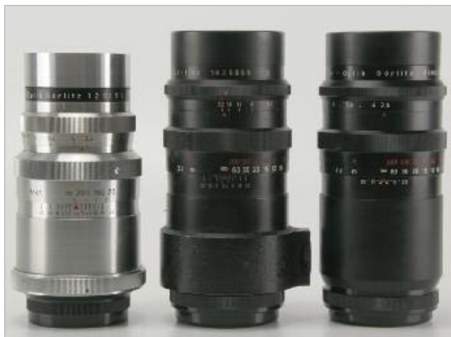
Auch das Primotar 3,5/180 war eine betagte Optik (links: Meister Korelle) als es an die Praktisix adaptiert wurde (rechts). Ähnlich, aber mit Stativschelle wurde es auch für das Kleinbild (mitte) neu aufgelegt. Anders als die älteren Versionen hatten diese Objektive dedizierte Anschlüsse und waren nicht mehr ohne weiteres an andere Systeme adaptierbar.

Carsten Bobsin praktisix@gmx.de Tel.: 030/710 93790 exakta66@arcor.de