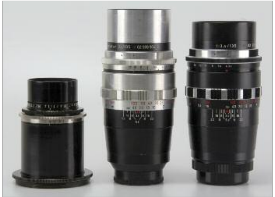
Das Primotar E 3,5/135 war für Praktisix mit automatischer Druckblende geplant gewesen (linkes Bild) ähnlich der des Primotar E 3,5/80. In den Dreißigern wurde das Primotar 3,5/135 an der Primarflex und anderen Mittelformatkameras verwendet (rechtes Bild, links). Auch für das Kleinbild war die Springblende in Planung (rechtes Bild, mitte: M42, rechts: Praktina).

verschieden ausgeführte Schärfentiefen- und Vorwahlskalen