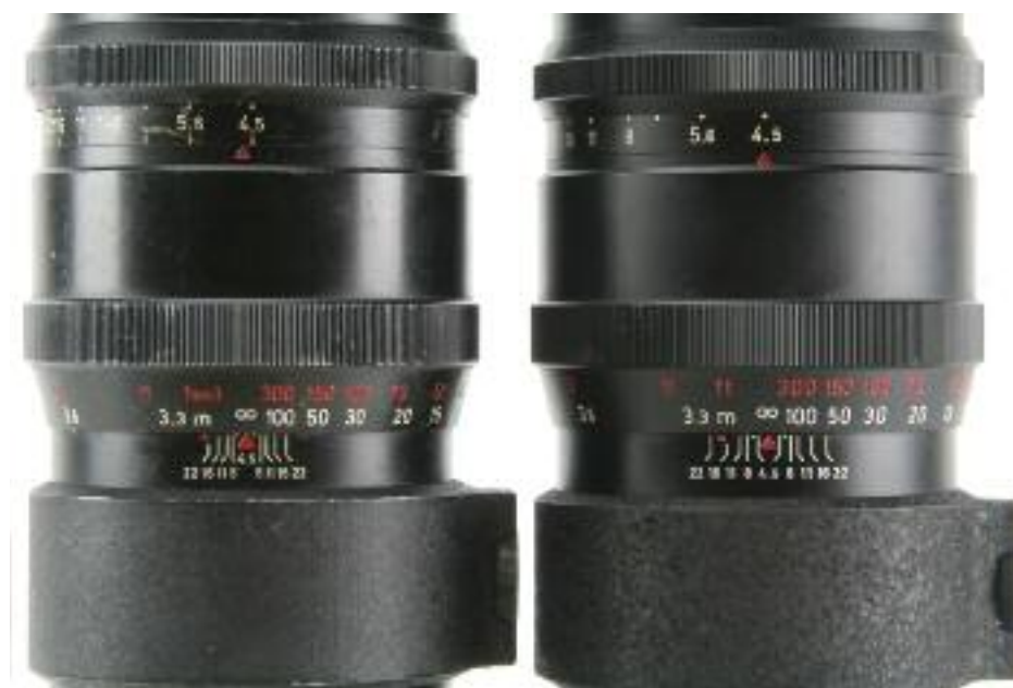
Bei frühen Meyer-Objektiven gibt es viele Varianten. Eigenartigerweise ist die Schärfentiefskala bei diesen beiden Telemegoren unterschiedlich breit ausgeführt.

Diese beiden Objektive waren erst kurz zuvor gerechnet. Weitere Zeit konnte damit gespart werden, dass man nicht alle Objektive mit der neuen, automatischen Springblende versah. Das einzige Manko neben den betagten Rechnungen war nur das Fehlen eines Weitwinkelobjektives. Man erinnere sich, die Kunst, ein Retrofokusobjektiv zu rechnen, war zu dieser Zeit noch sehr jung (1949: unabhängig voneinander Angenieux und auch Carl Zeiss Jena).