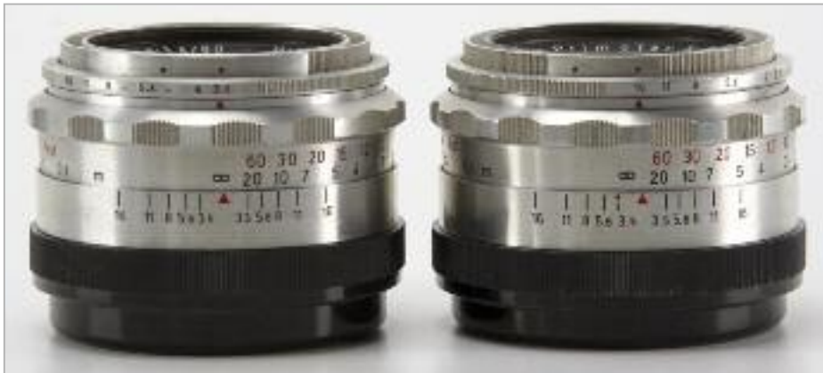
Die Besonderheit des neuen Primotar E 3,5/80 ist die automatische Springblende. Durch einen gerändelten Ring am vorderen Ende lässt sich die Automatik (roter Punkt) auch abschalten (schwarzer Punkt). Drei leicht unterschiedliche Varianten sind bekannt: geteilter Rändel ohne Infrarotindex (links), mit Infrarotindex (o. Abb.), und schließlich umlaufender Rändel des Automatikringes (rechts).